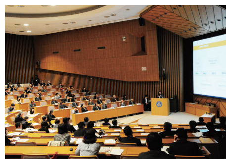
国際セミナーの様子